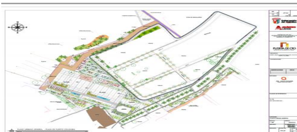
Ilustración 1. Diseño arquitectónico de la plaza del municipio de Puerto Colombia.

En la documentación se presentaron los planos de los diseños arquitectónicos de las plazas del municipio de Puerto Colombia (Ilustración 1) y Usiacurí (Ilustración 2).