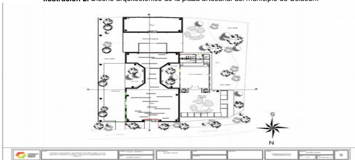
Ilustración 2. Diseño arquitectónico de la plaza artesanal del municipio de Usiacurí.

Posteriormente, en la documentación se presenta los inventarios forestales de los individuos arbóreos que se requieren talar para la ejecución del proyecto en cada municipio y de los individuos arbóreos susceptibles a actividades de podas.